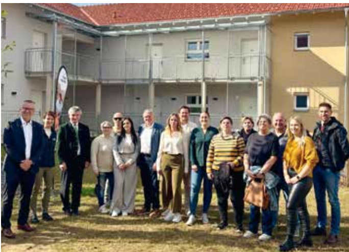
Die neuen Bewohner mit Ehrengästen vor dem ÖWG Wohnhaus.