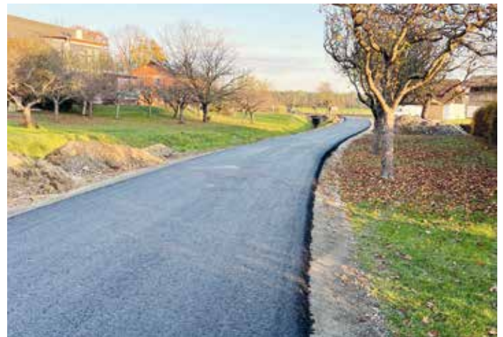
Untere Dorfstraße Hohenbrugg

Die im Juni 2024 durch das Hochwasser verursachten Straßenschäden in Voitmann und Geier konnten Anfang November vollständig behoben werden. Unter der Bauaufsicht der A7 – Ländlicher Wegebau wurden die betroffenen Abschnitte saniert und in einen sehr guten Zustand gebracht. Auch die Bewohnerinnen und Bewohner von Hohenbrugg dürfen sich freuen: Bei der Unteren Dorfstraße sowie beim Dornweg wurde die Oberflächenentwässerung erneuert, die Tragfähigkeit durch das Aufbringen von Schottermaterial verbessert und die Fahrbahn anschließend neu asphaltiert. Damit sind diese Wege wieder bestens für den täglichen Verkehr gerüstet.