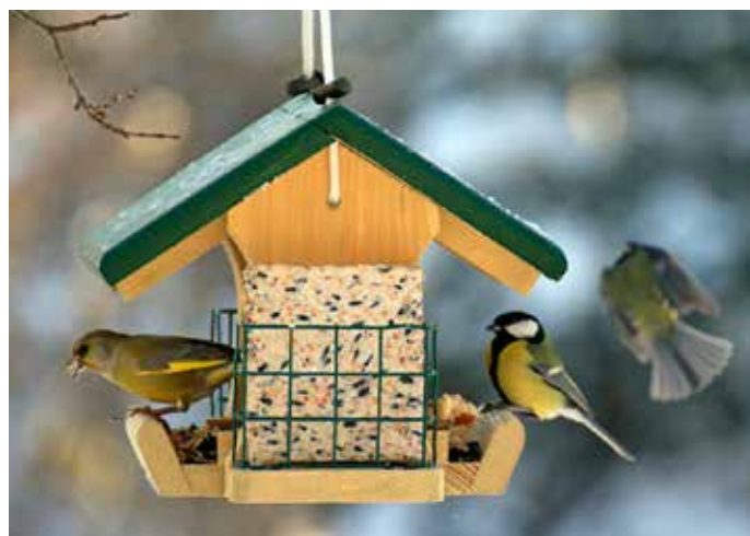
Vögel am Futterhäuschen