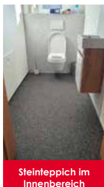
Steinteppich im Innenbereich