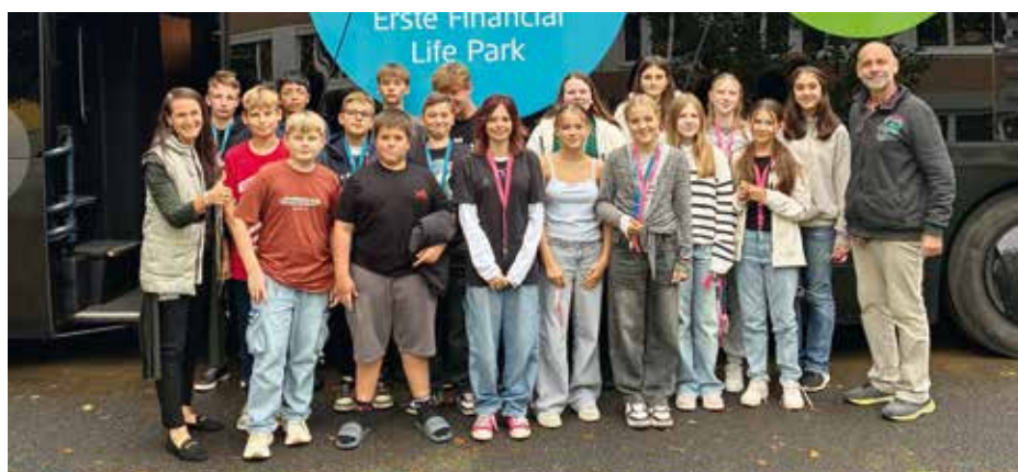
Flip Bus in der Mittelschule Bad Waltersdorf