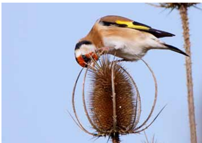
Stieglitz beim Fressen auf der Wilden Karde

Nicht zu unterschätzen ist ein vogelfreundlich angelegter Garten. Sträucher und Hecken mit leuchtenden Beeren sind nicht nur dekorativ, sondern auch eine wertvolle Nahrungsquelle. Ebenso beliebt sind die Samen verschiedener Stauden – etwa von Pfaffenhütchen, Schlehe, Berberitze, Liguster, Schneeball, Karde und Distel. Sie bieten den gefiederten Gästen eine abwechslungsreiche und natürliche Ernährung.