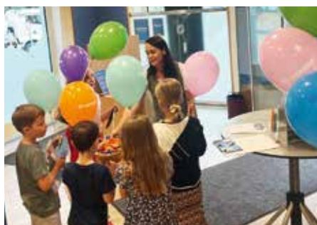
Schulschluss: Eisgutschein für alle!