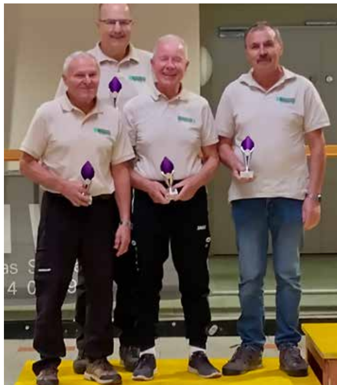
2. Platz beim Bezirksstocksport im Oktober 2025