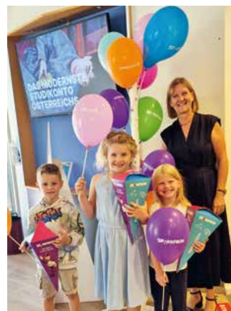
Schultüte für alle Tafelklassler