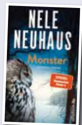
Nele Neuhaus Monster

Die 16-jährige Lissy wird ermordet aufgefunden. Verdächtig wird ein afghanischer Asylbewerber. Ein Mann wird von einem Auto überfahren, übelst zugerichtet und stirbt. Ein unterhaltsamer und spannender Krimi, der den Leser von Anfang bis zum Ende in Hochspannung hält.