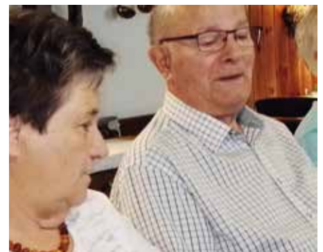
Golden Hochzeit Familie Handler

Nächster Geburts-/Hochzeitstagkränzchen-Termin: 28. Dezember 2023, 15 Uhr!