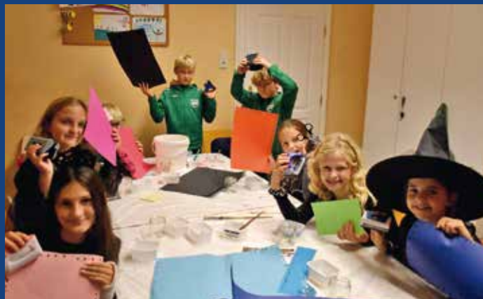
Allerheiligen & Halloween