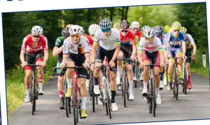
35. Radjudentour Oststeiermark