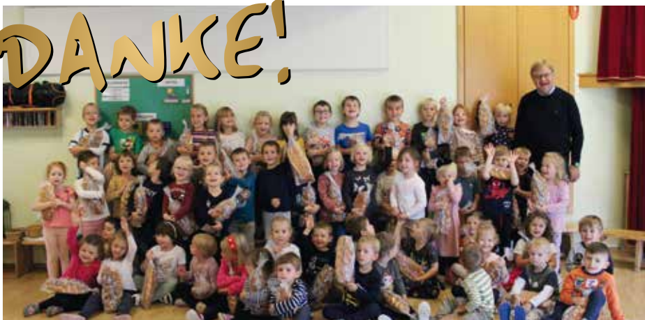
Ein großes DANKE an Herrn Bürgermeister für den alljährlichen Allerheiligenstriezel.