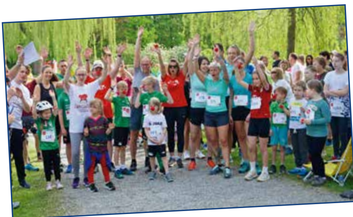
Rote Nasen Lauf