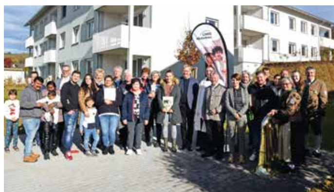
Die neuen Bewohner mit Ehrengästen vor dem ÖWG Wohnhaus.