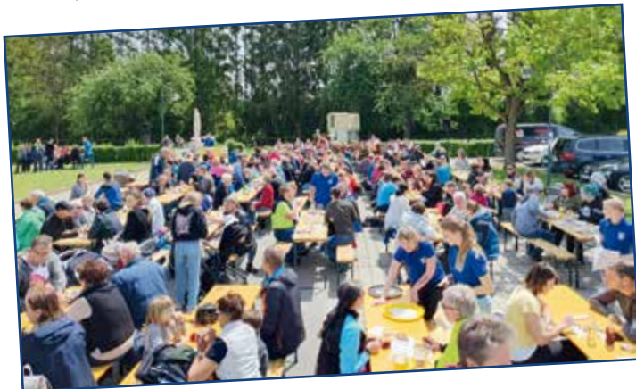
1. Musi-Wandertag MMK