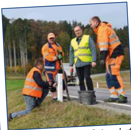
Wildwarnreflektoren in Leitersdorf