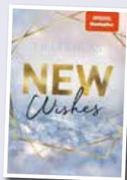
Lilly Luca New Wishes

Die 16-jährige Lissy wird ermordet aufgefunden. Verdächtig wird ein afghanischer Asylbewerber. Ein Mann wird von einem Auto überfahren, übelst zugerichtet und stirbt. Ein unterhaltsamer und spannender Krimi, der den Leser von Anfang bis zum Ende in Hochspannung hält.